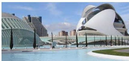
Ciudad de las Artes y Ciencias, Valencia

Seit dem Schuljahr 2017/18 sind wir im Aufbau eines Schüleraustauschprogramms für Spanisch lernende Schülerinnen und Schüler der Klasse 9. Unsere Partnerschule befindet sich in Santomera, in der Nähe von Murcia im Südosten Spaniens. Während ihres Aufenthaltes in Gastfamilien haben die Schülerinnen und Schüler Gelegenheit sowohl die spanische Sprache und Kultur als auch den Schulalltag ihrer Austauschpartner kennen zu lernen. Im Laufe des einwöchigen Aufenthaltes wird ihnen ein unterhaltsames Programm geboten. Alternativ dazu besteht die Möglichkeit eine Sprachschule in Valencia zu besuchen. Hier findet vormittags Sprachunterricht statt und nachmittags erkunden unsere 9.Klässler die Stadt und Region bei einem abwechslungsreichen Freizeit- und Kulturprogramm. Die Unterbringung erfolgt hier ebenfalls bei spanischen Gastfamilien.