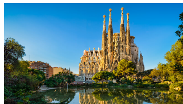
Gaudis Sagrada Familia, Barcelona